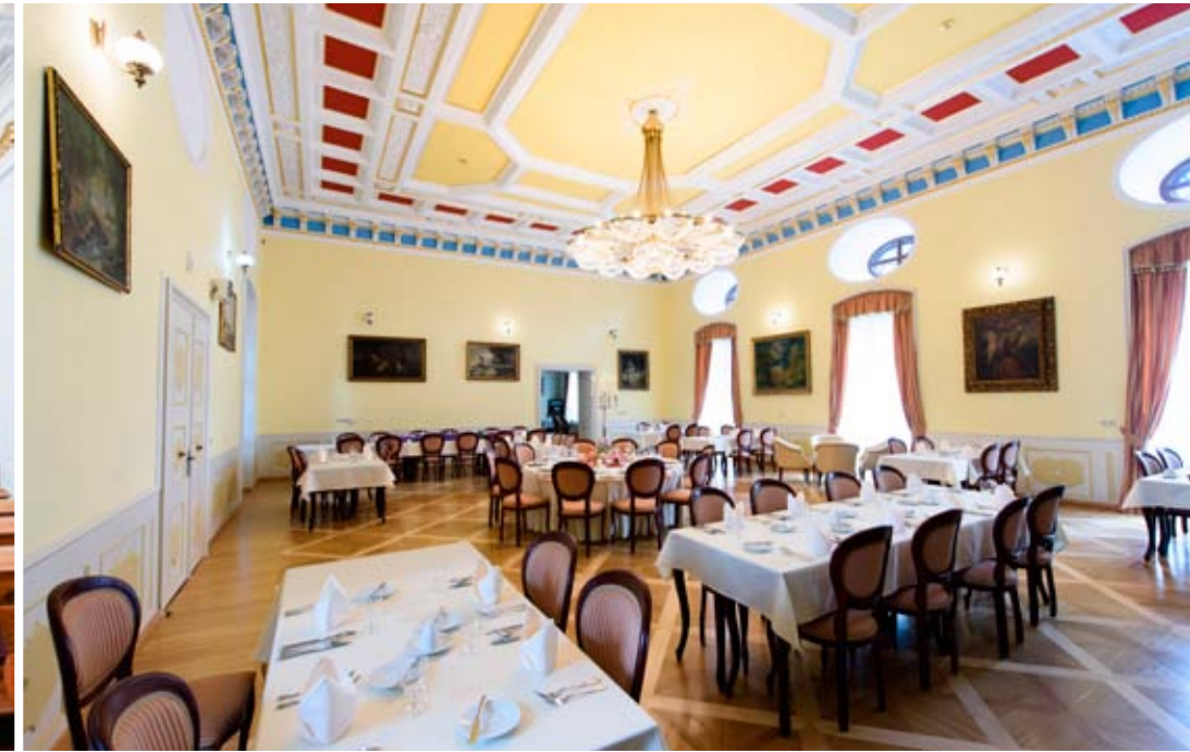
Bývalá reprezentačná sála so stropom s bohatou plastickou štukovou výzdobou, zvýraznenou zlátením a sýtou farebnosťou, sa zmenila na reštauráciu Kolchury.