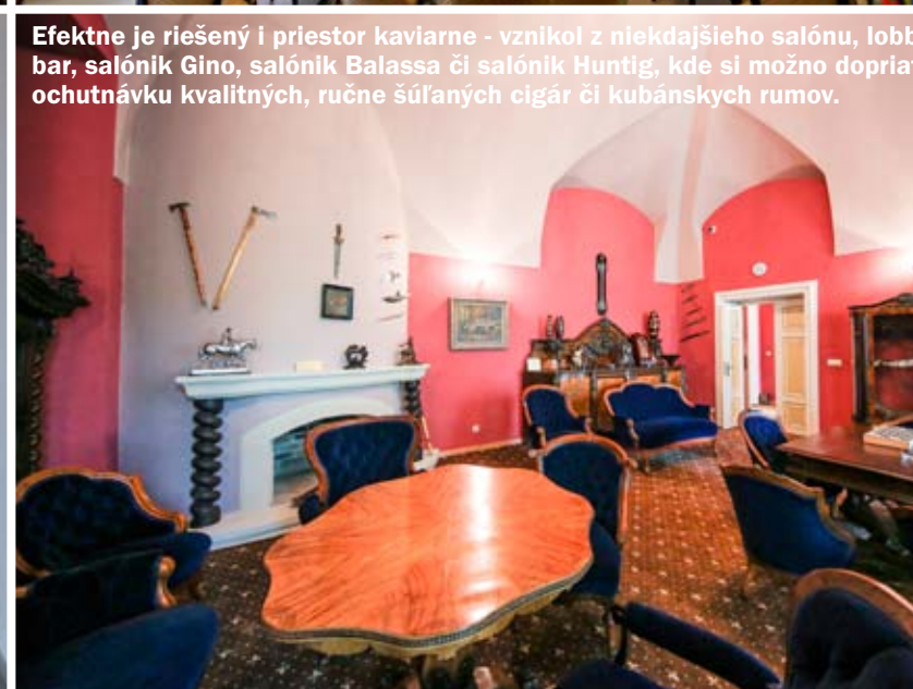
Efektne je riešený i priestor kaviarne - vznikol z niekdajšieho salónu, lobby bar, salónik Gino, salónik Balassa či salónik Huntig, kde si možno dopriať ochutnávku kvalitných, ručne súľaných cigár či kubánskych rumov.

kaviarne - vznikol z niekdajšieho salónu, lobby bar, salónik Gino, salónik Balassa či salónik Huntig, kde si hostia môžu dopriať ochutnávku kvalitných, ručne súľaných cigár či kubánskych rumov. Kardinálsku červeň stien zaplňa inštalácia historických zbraní. Zariadenie klenutého komorného priestoru s mramorovým ostením krbu pozostáva z neobarokového historického nábytku a originálnej sedacej garnitúry. Predmety muzeálnej hodnoty a výtvarne originály patria nielen k histórii kaštieľa, ale podieľajú sa i na vytvorení jeho súčasnej autentickej historickej atmosféry.