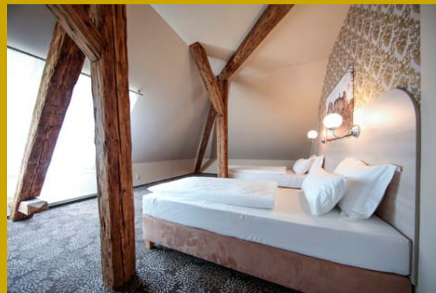
Podkrovné izby zaujmú priznaním komplikovaných trámových konštrukcií, ktoré im dodávajú francúzsky vidiecky ráz.