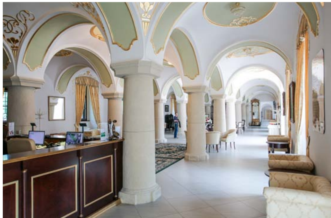
Nový vstup a prijímacia hala s recepciou vznikol otvorením bočného krídla do priestoru niekdajšej koniarne.