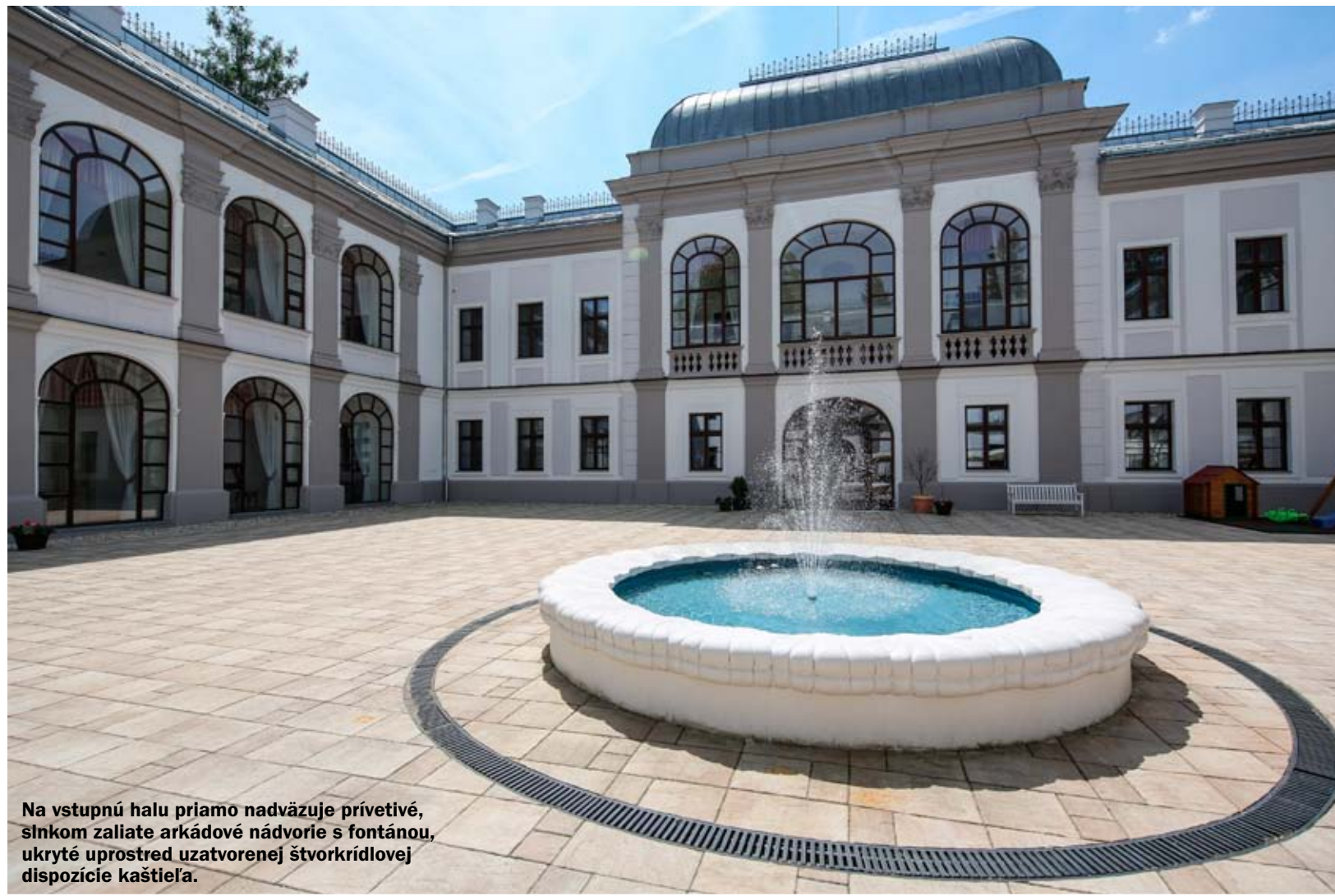
Na vstupnú halu priamo nadväzuje prívétivé, slnkom zaliaté arkádové nádvorie s fontánou, ukryté uprostred uzatvorenej štvorkrídlovej dispozície kaštieľa.