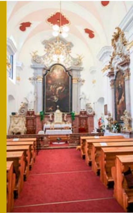
Takmer v nenarušenom stave sa dodnes zachovala kaštieľna kaplnka vybavená neskorobarokovým liturgickým mobiliárom v ktorej sa konajú svadobné obrady.